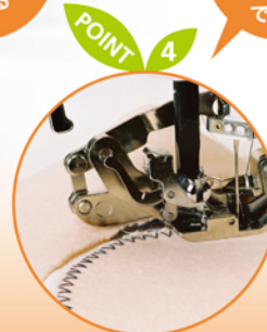
スーパーラウンドロック付