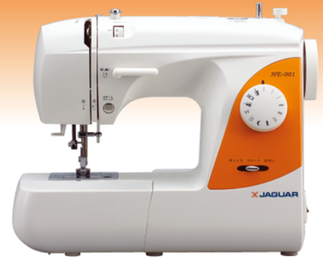
ジャガー電子ミシン HE-001