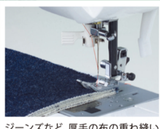
ジーンズなど、厚手の布の重ね縫いもパワフルソーイング! ※生地の厚みにより、縫える枚数が異なります。