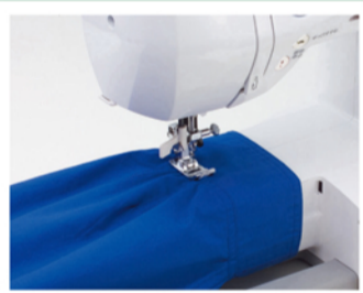
アクセサリボックスを外すと、筒縫いなどに便利なフリーアームに。