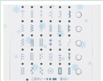
豊富な縫い模様は30種類。 (ボタンホール2種)