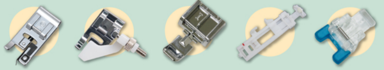
端縫い押え かくし縫い押え ファスナー押え ボタンホール押え ボタン付け押え