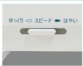
スピード調節は低速から高速まで自由自在。