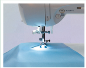
とても明るく作業性がアップするLED採用の手もとライト。