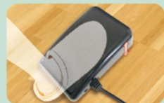
※オプション(別売り)