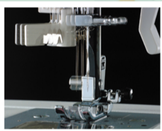
直線縫いは縫い位置を13カ所から自由に変更可能。