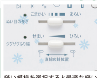
縫い模様を選択すると最適な縫い目長さ・幅に自動設定。つまみを動かして簡単に微調整もできます。