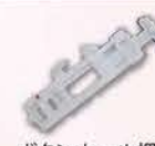
ボタンホール押え