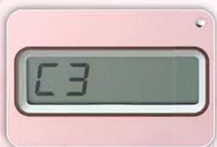
エラーメッセージ表示機能