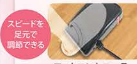
フットコントローラー